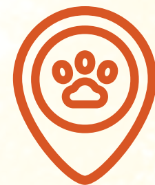
Zona de mascotas