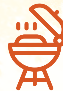
Terraza con bbq