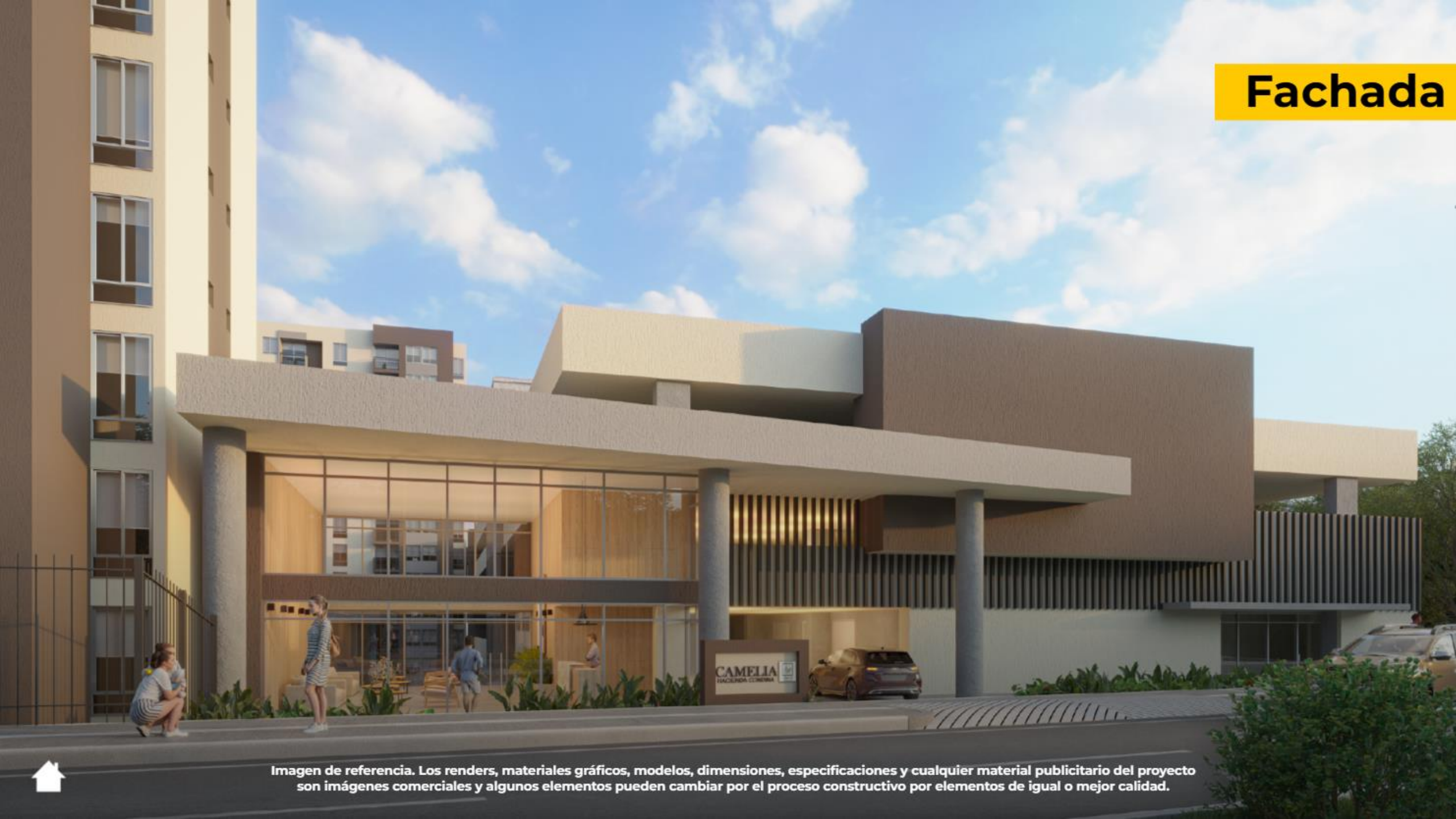
Imagen de referencia. Los renders, materiales gráficos, modelos, dimensiones, especificaciones y cualquier material publicitario del proyecto son imágenes comerciales y algunos elementos pueden cambiar por el proceso constructivo por elementos de igual o mejor calidad.