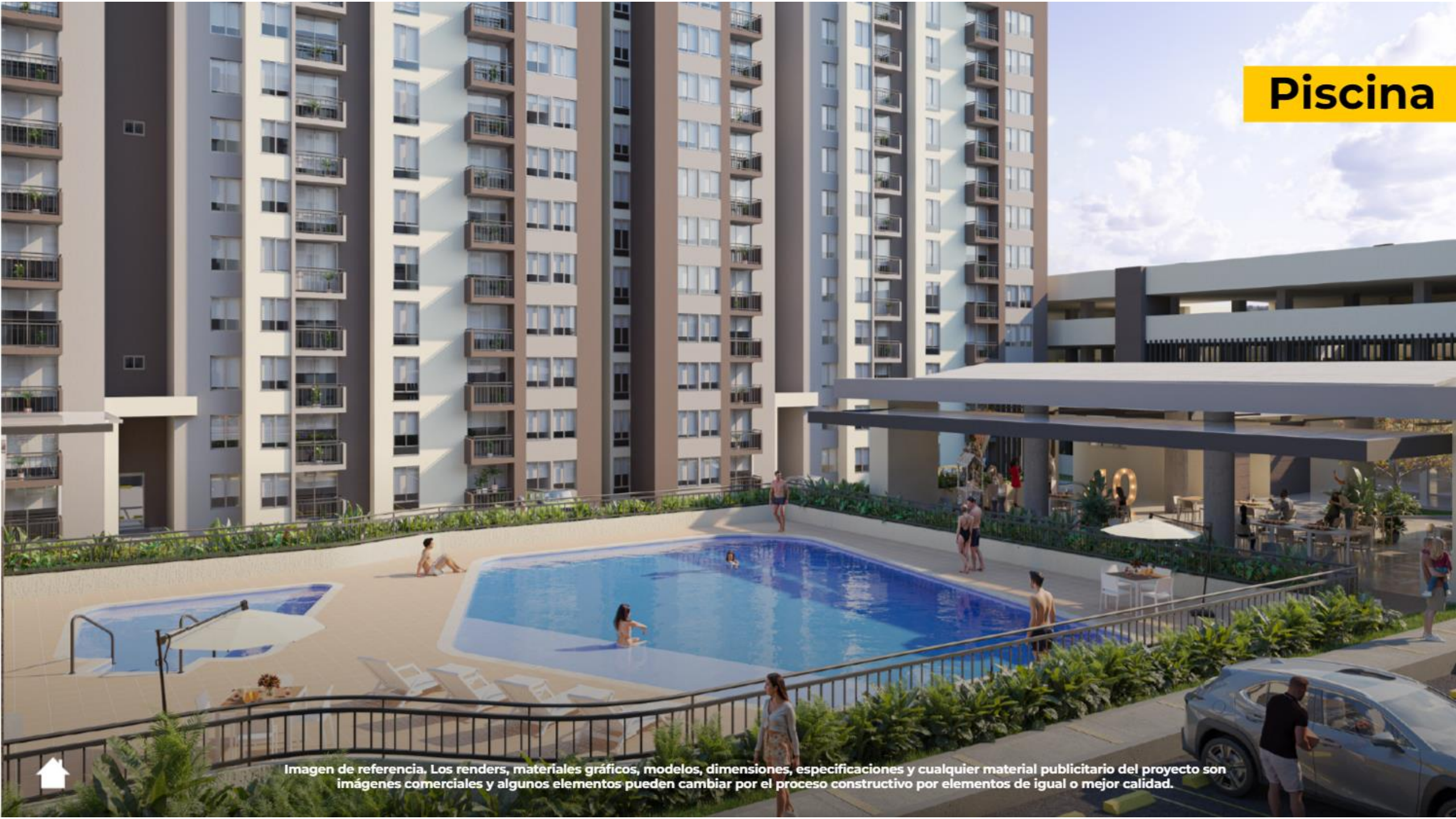
Imagen de referencia. Los renders, materiales gráficos, modelos, dimensiones, especificaciones y cualquier material publicitario del proyecto son imágenes comerciales y algunos elementos pueden cambiar por el proceso constructivo por elementos de igual o mejor calidad.