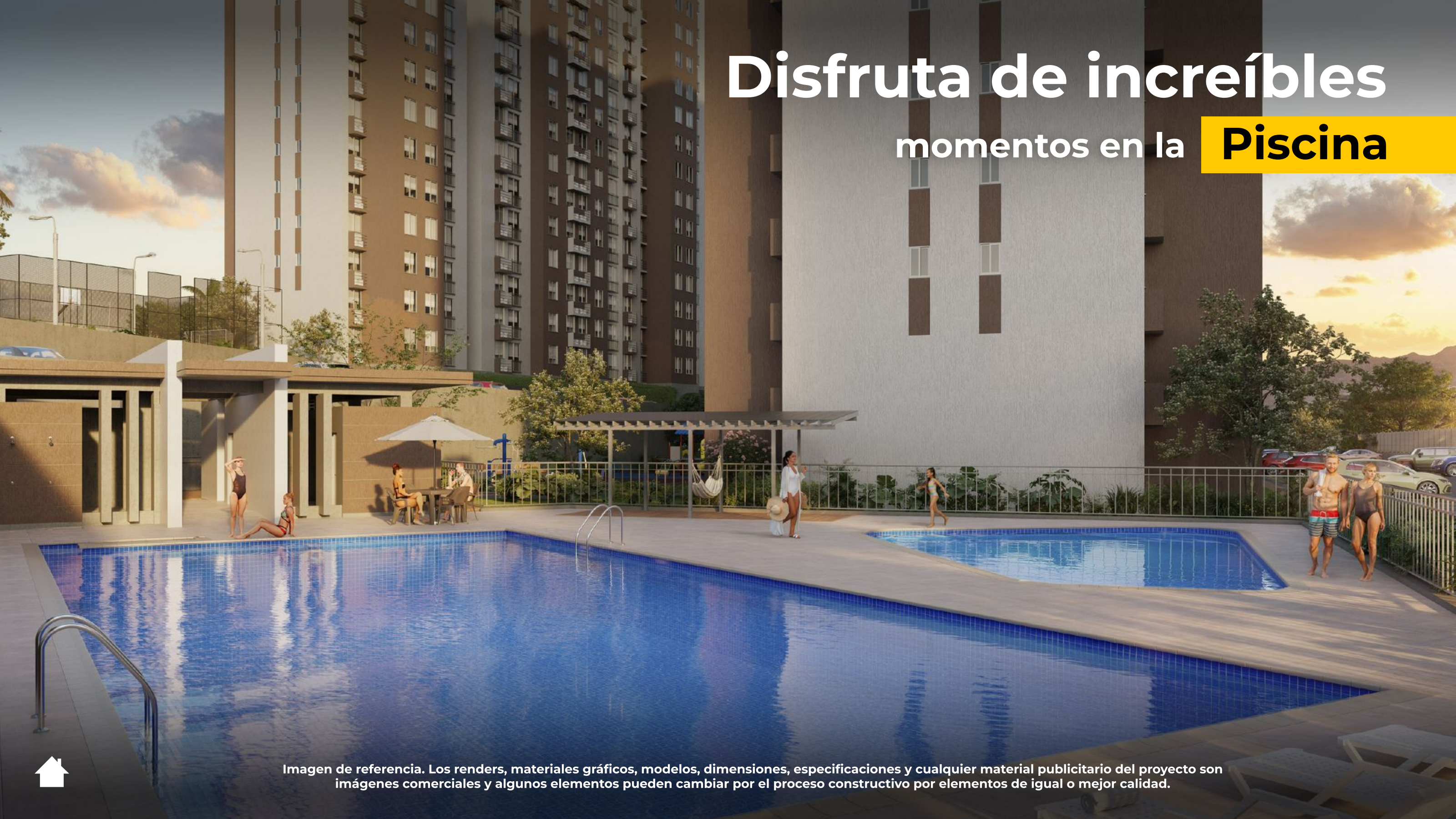
Imagen de referencia. Los renders, materiales gráficos, modelos, dimensiones, especificaciones y cualquier material publicitario del proyecto son imágenes comerciales y algunos elementos pueden cambiar por el proceso constructivo por elementos de igual o mejor calidad.