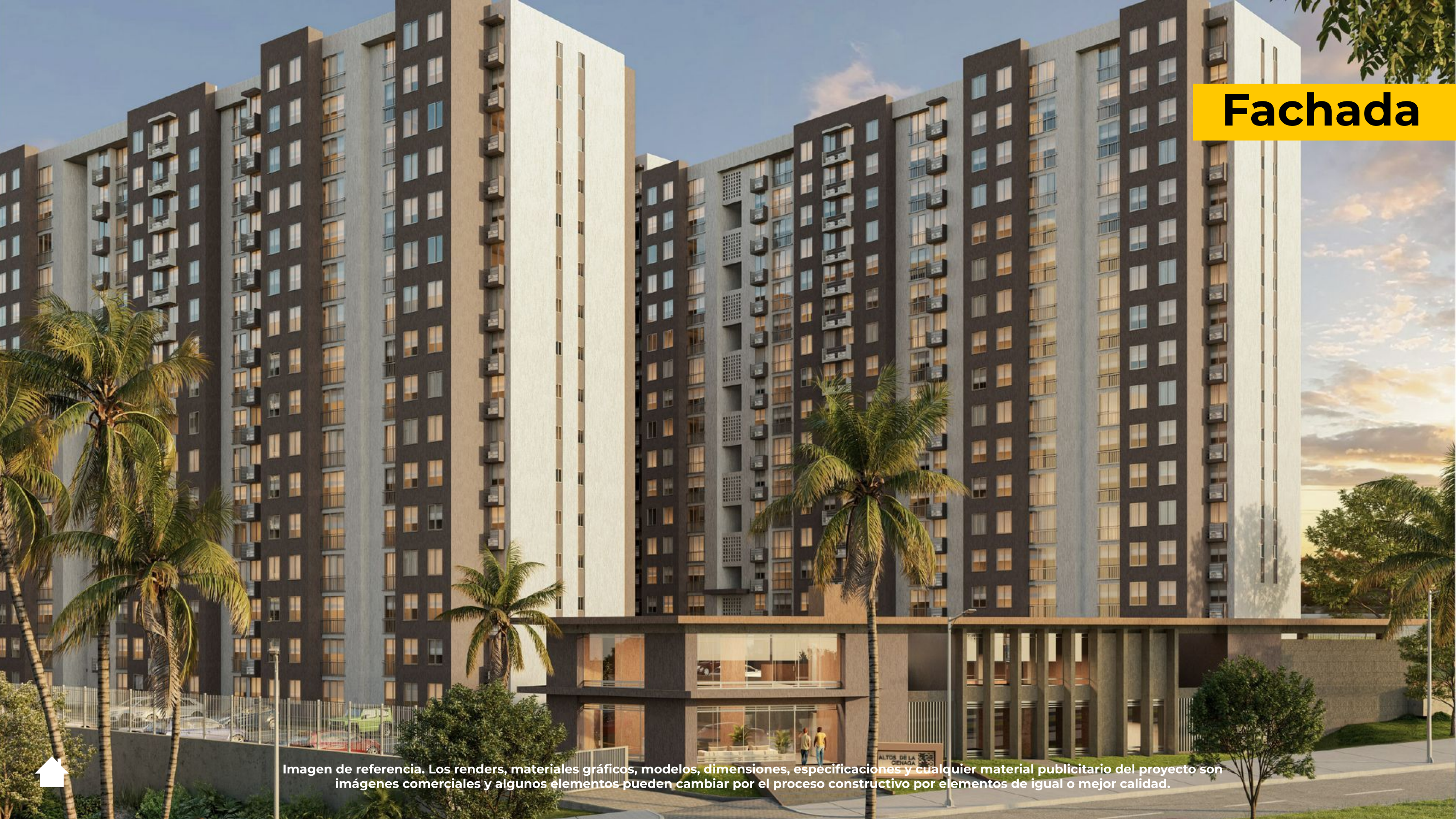
Imagen de referencia. Los renders, materiales gráficos, modelos, dimensiones, especificaciones y cualquier material publicitario del proyecto son imágenes comerciales y algunos elementos pueden cambiar por el proceso constructivo por elementos de igual o mejor calidad.