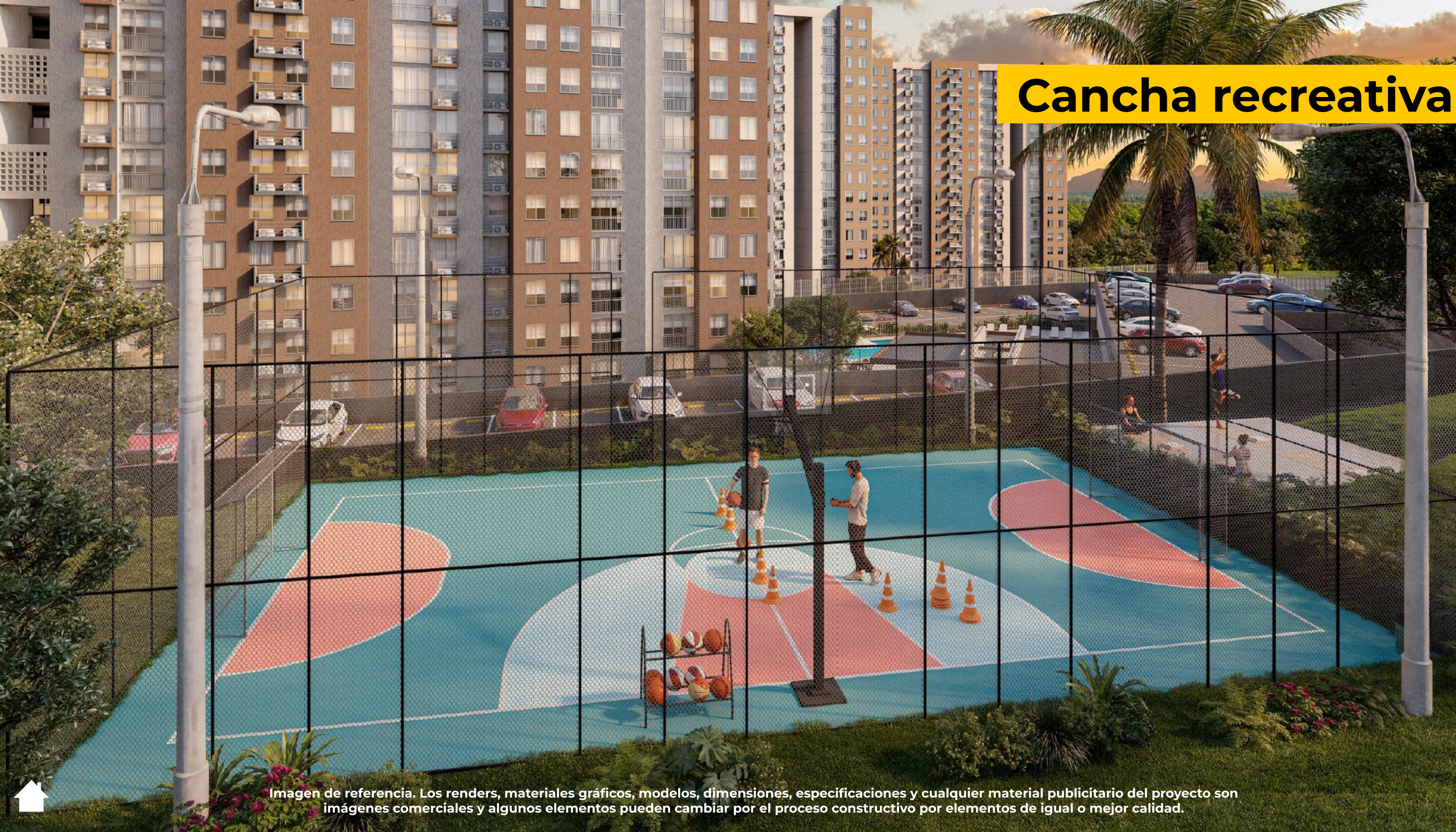
Imagen de referencia. Los renders, materiales gráficos, modelos, dimensiones, especificaciones y cualquier material publicitario del proyecto son imágenes comerciales y algunos elementos pueden cambiar por el proceso constructivo por elementos de igual o mejor calidad.