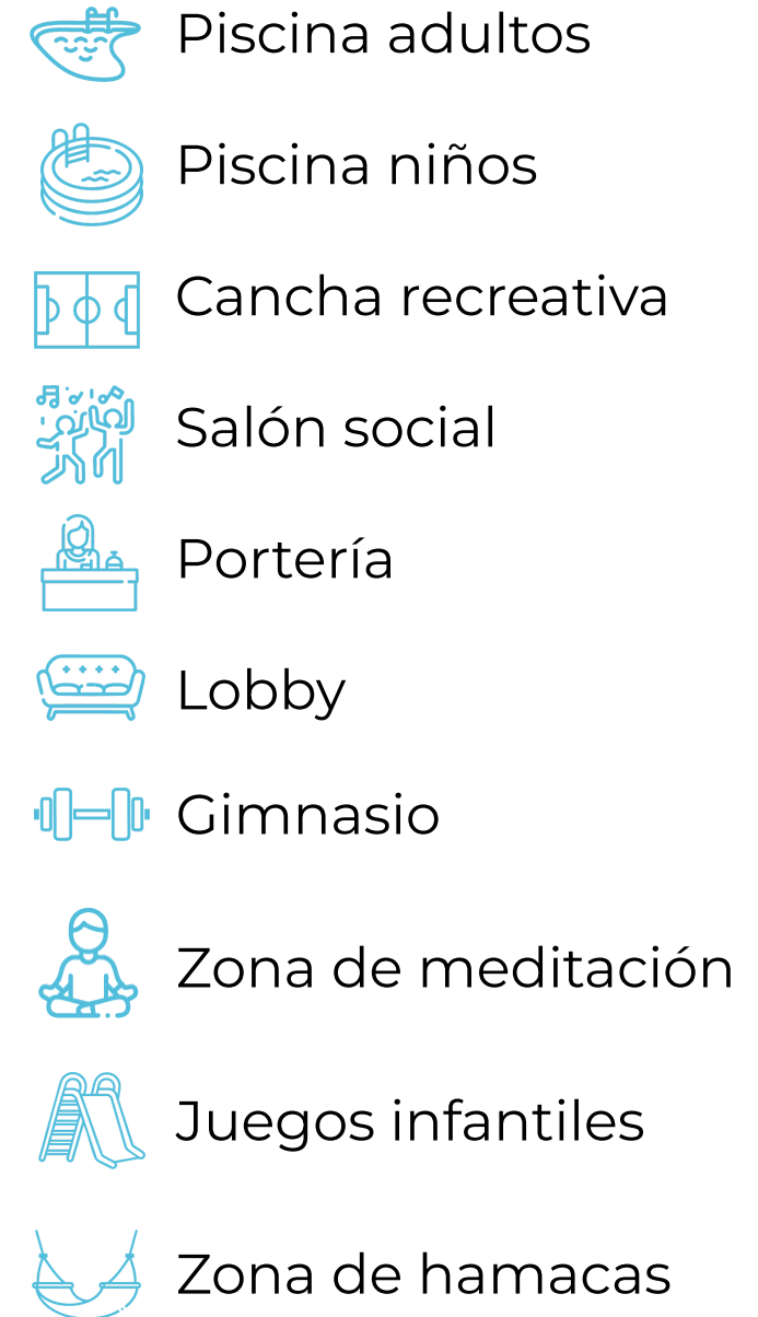
Imagen de referencia. Los renders, materiales gráficos, modelos, dimensiones, especificaciones y cualquier material publicitario del proyecto son imágenes comerciales y algunos elementos pueden cambiar por el proceso constructivo por elementos de igual o mejor calidad.