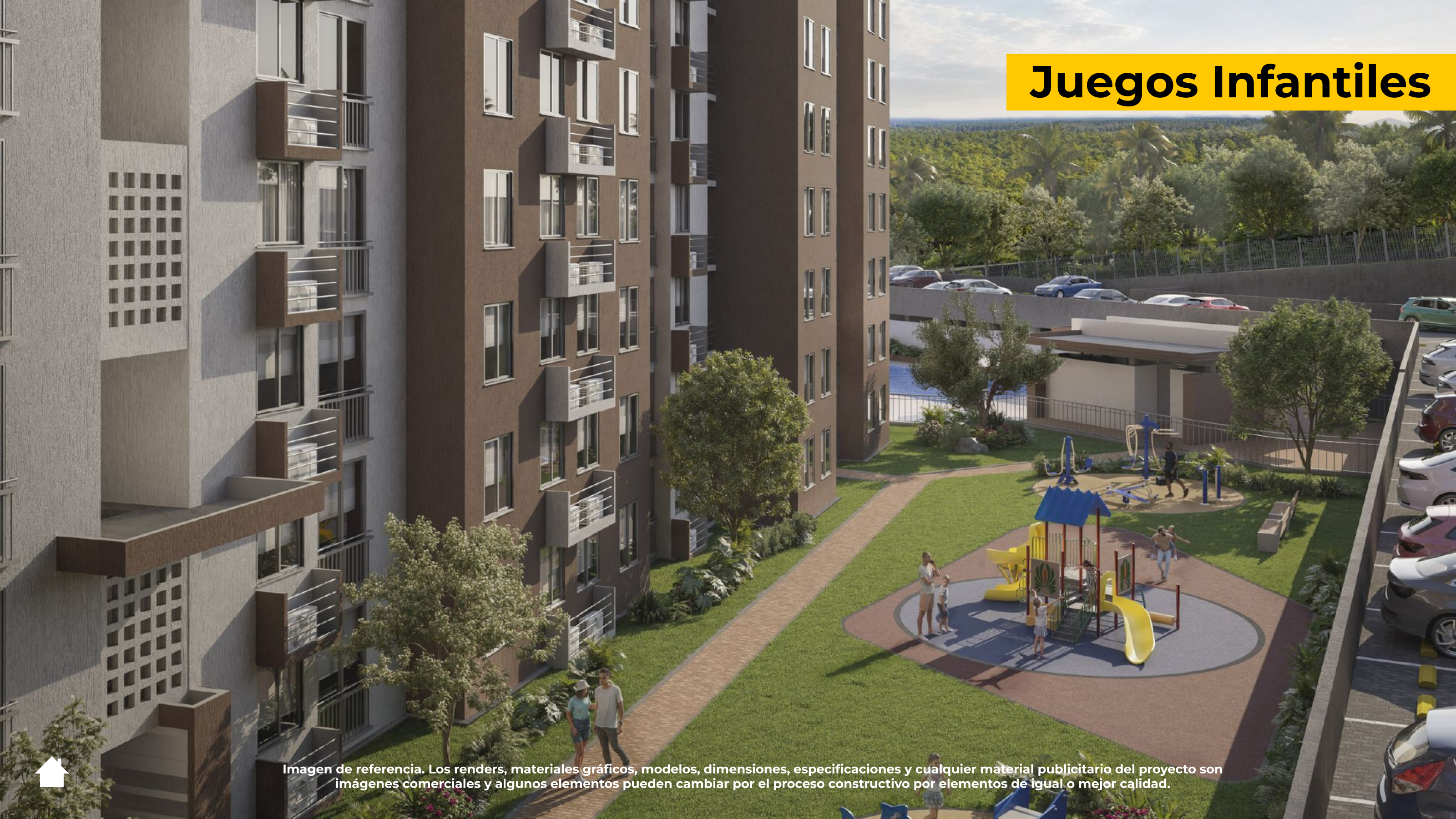
Imagen de referencia. Los renders, materiales gráficos, modelos, dimensiones, especificaciones y cualquier material publicitario del proyecto son imágenes comerciales y algunos elementos pueden cambiar por el proceso constructivo por elementos de igual o mejor calidad.