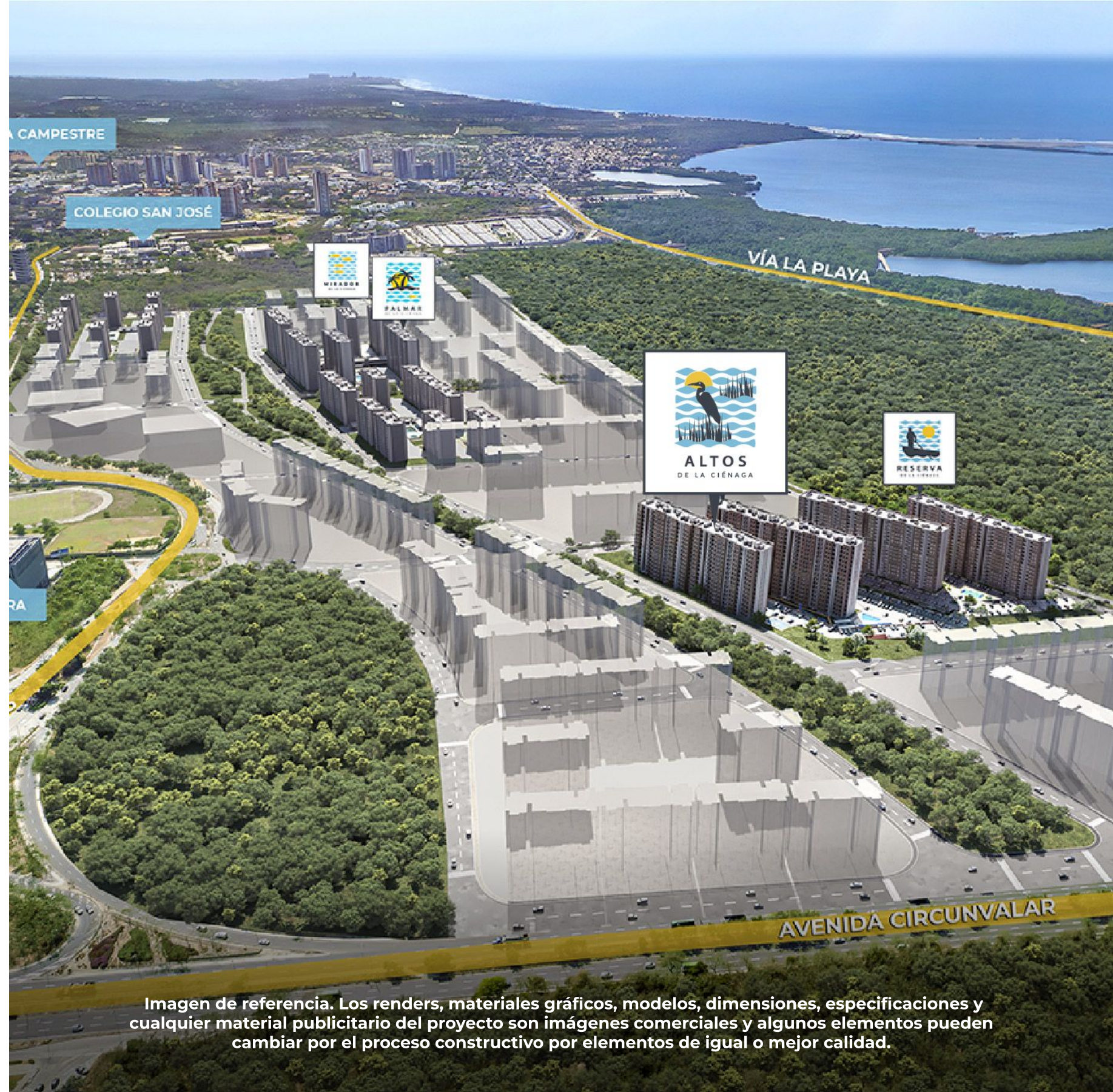
Imagen de referencia. Los renders, materiales gráficos, modelos, dimensiones, especificaciones y cualquier material publicitario del proyecto son imágenes comerciales y algunos elementos pueden cambiar por el proceso constructivo por elementos de igual o mejor calidad.

Su ubicación, a solo una cuadra de la Av. Circunvalar, te acerca a lo mejor del norte de Barranquilla: universidades, centros comerciales, clínicas y colegios. Una oportunidad única para vivir o invertir en un lugar que transforma tu día a día .