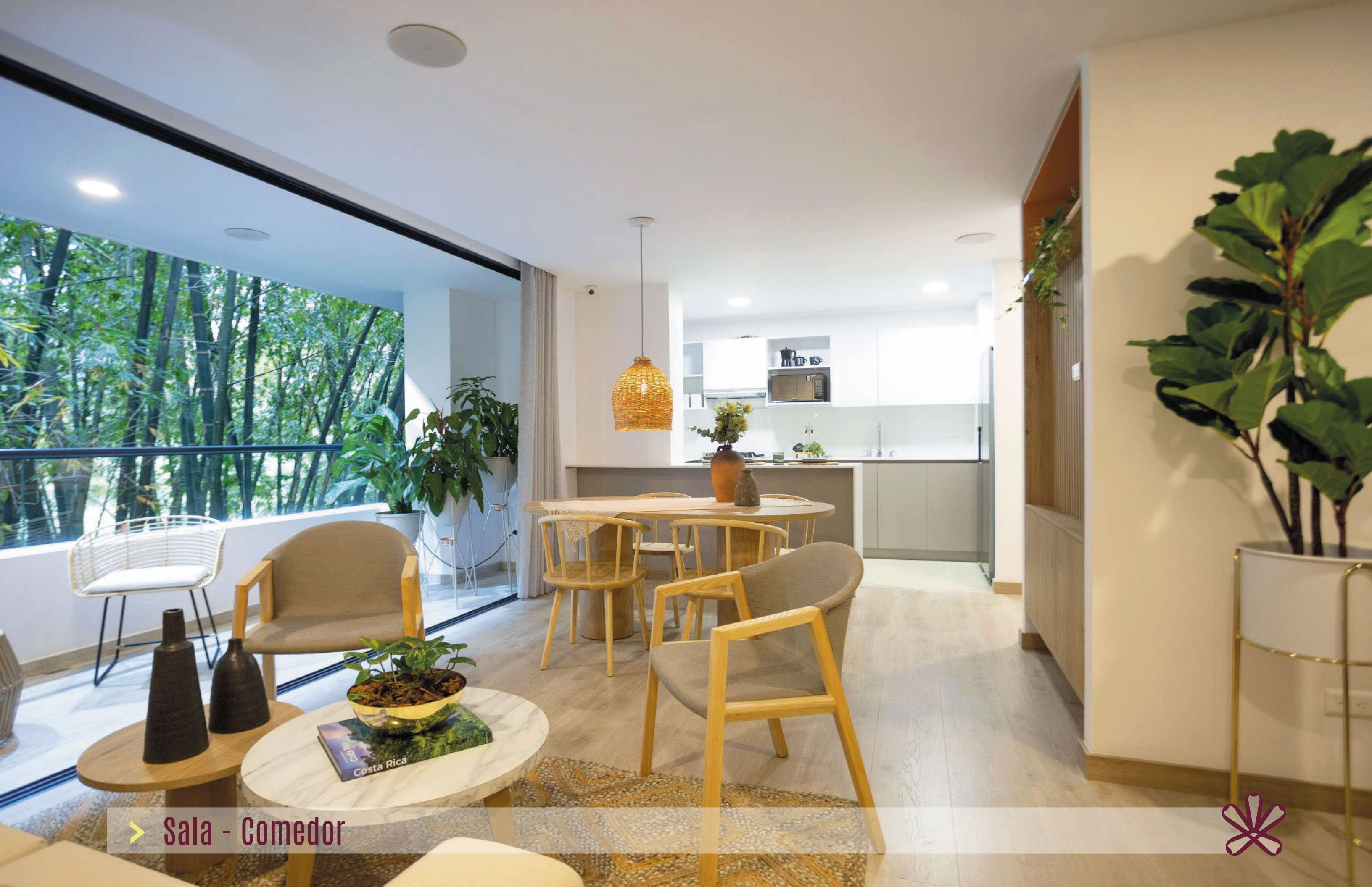
> Sala - Comedor