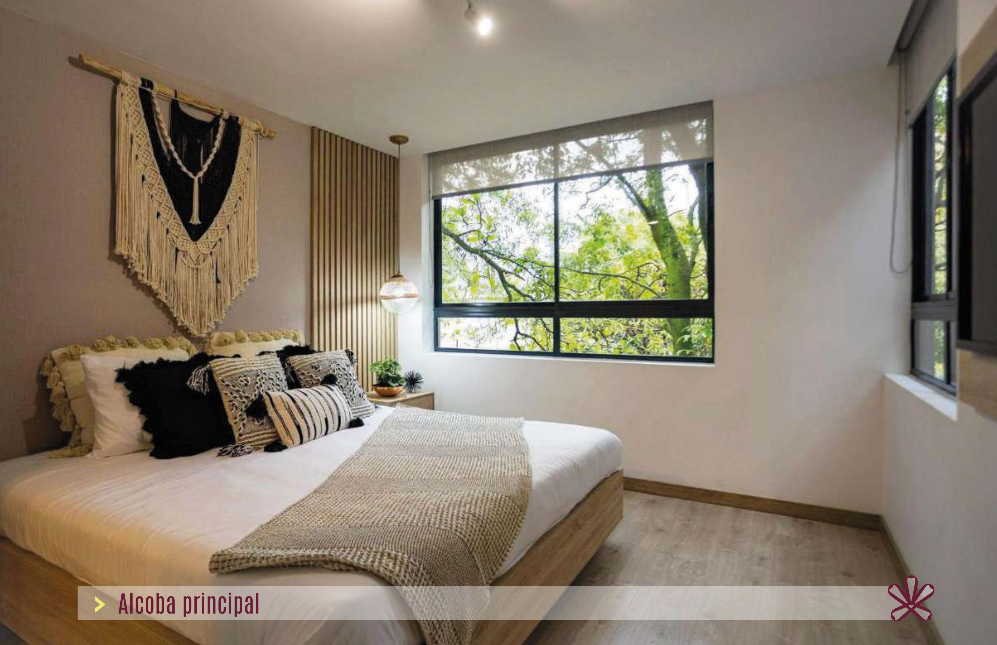
> Alcoba principal