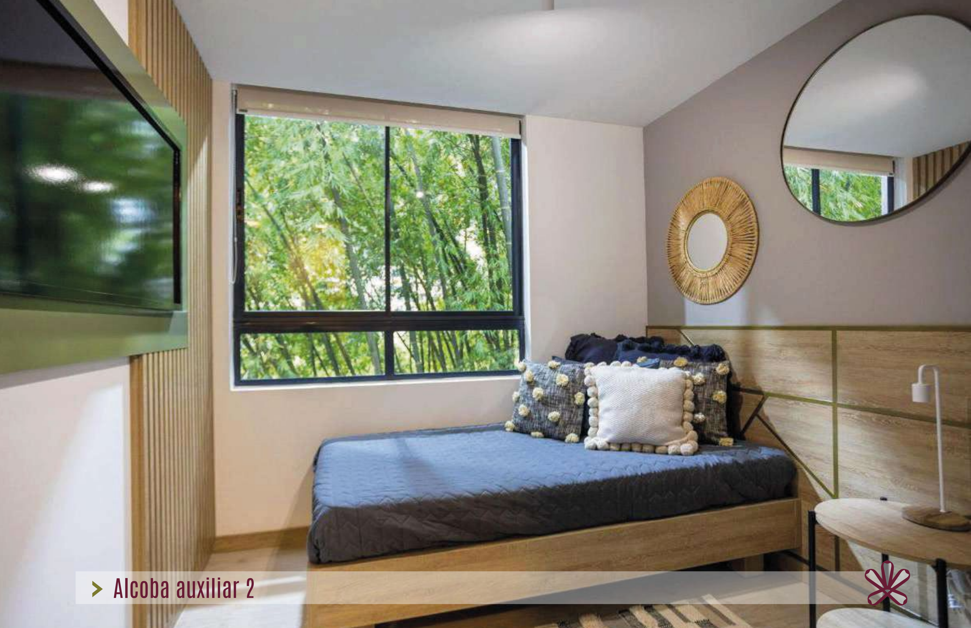
➤ Alcobia auxiliar 2