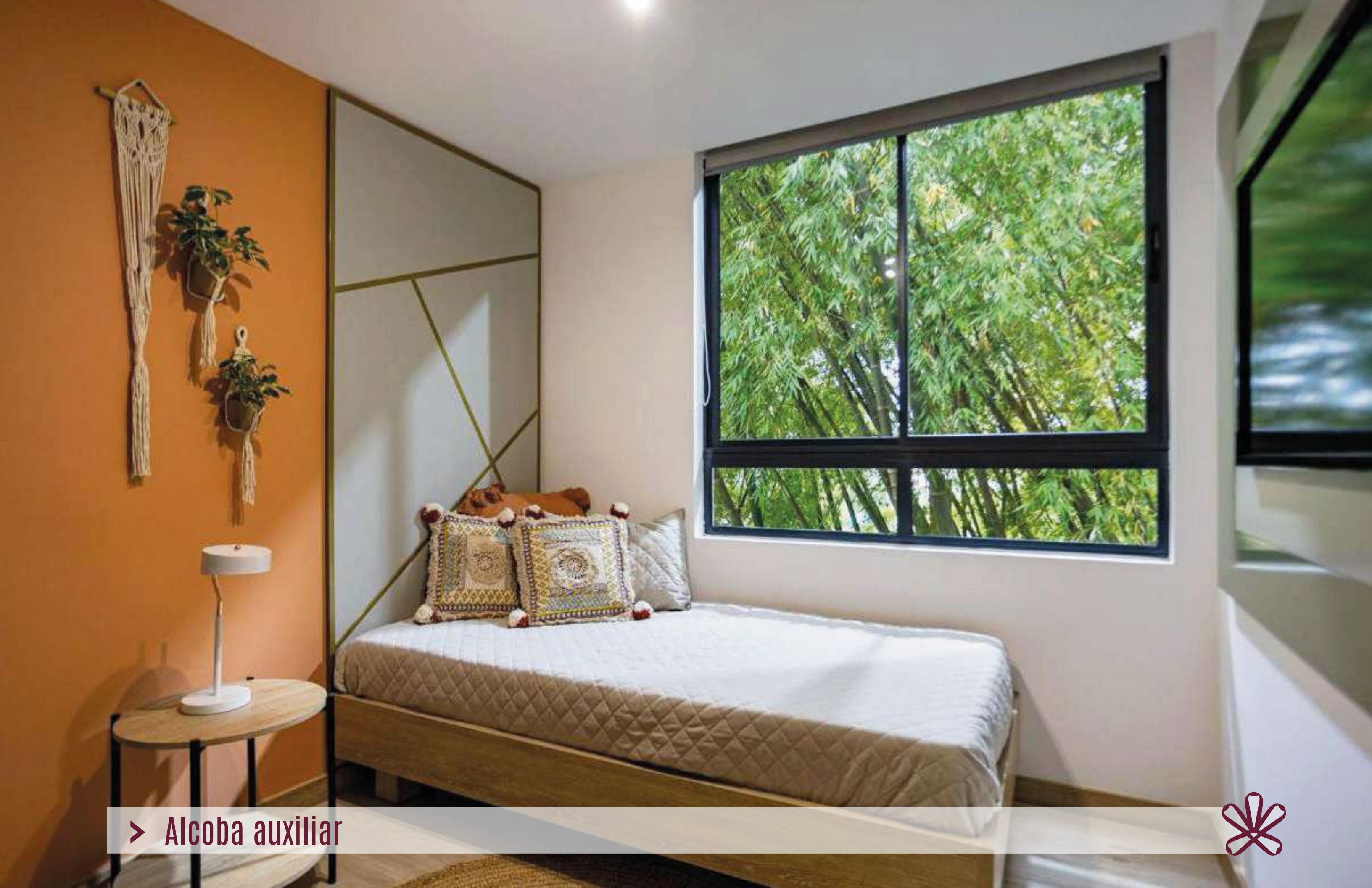
> Alcoba auxiliar