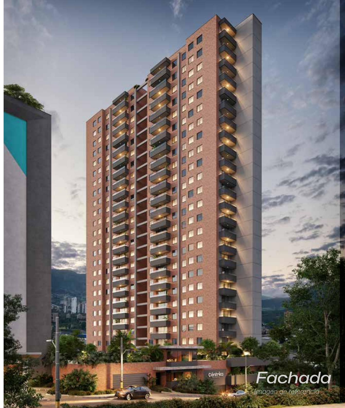
Fachada Imagen de referencia