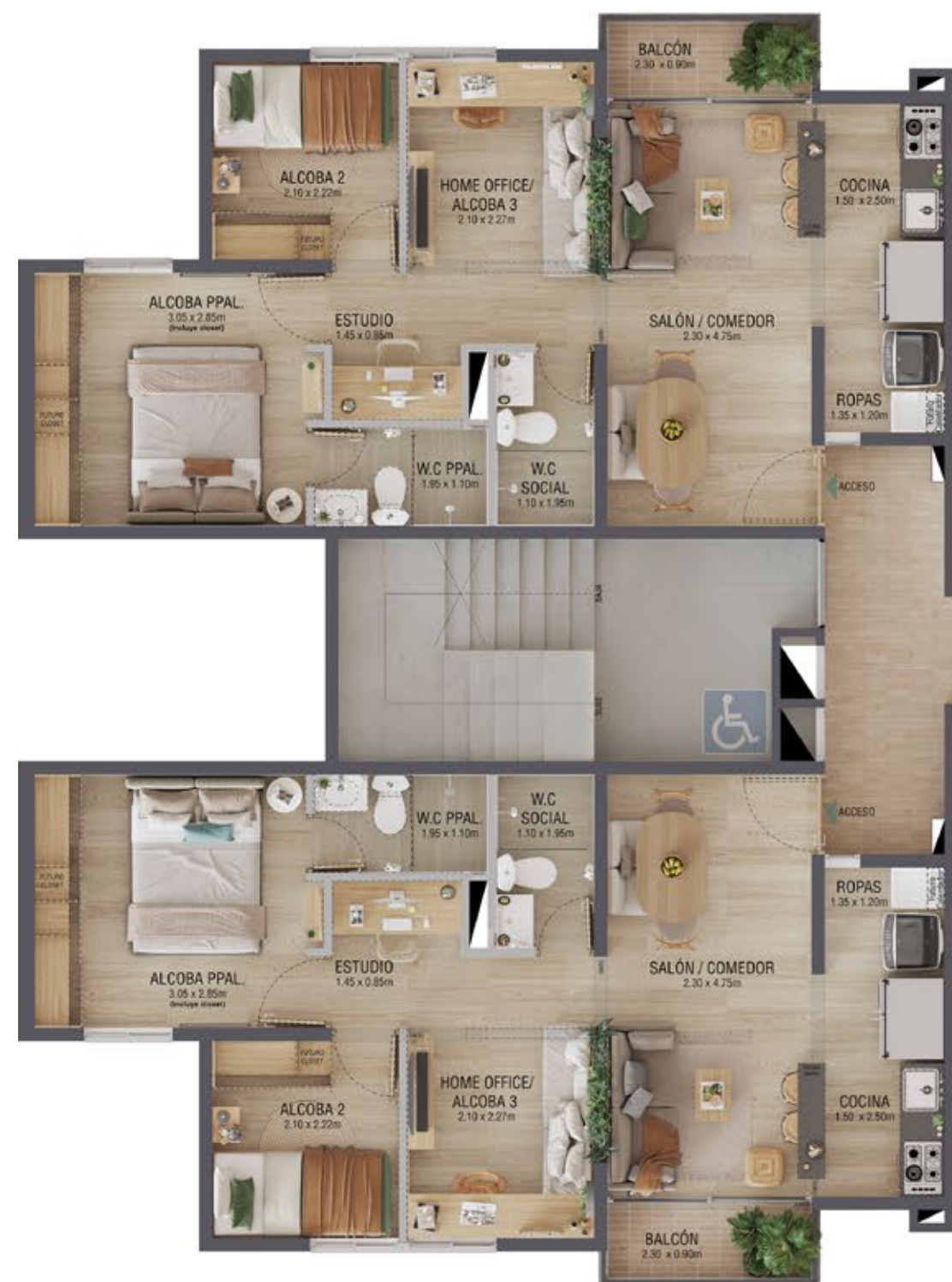
TIPO 1 Área total construida 52 m 2 Área total privada 46,46m 2