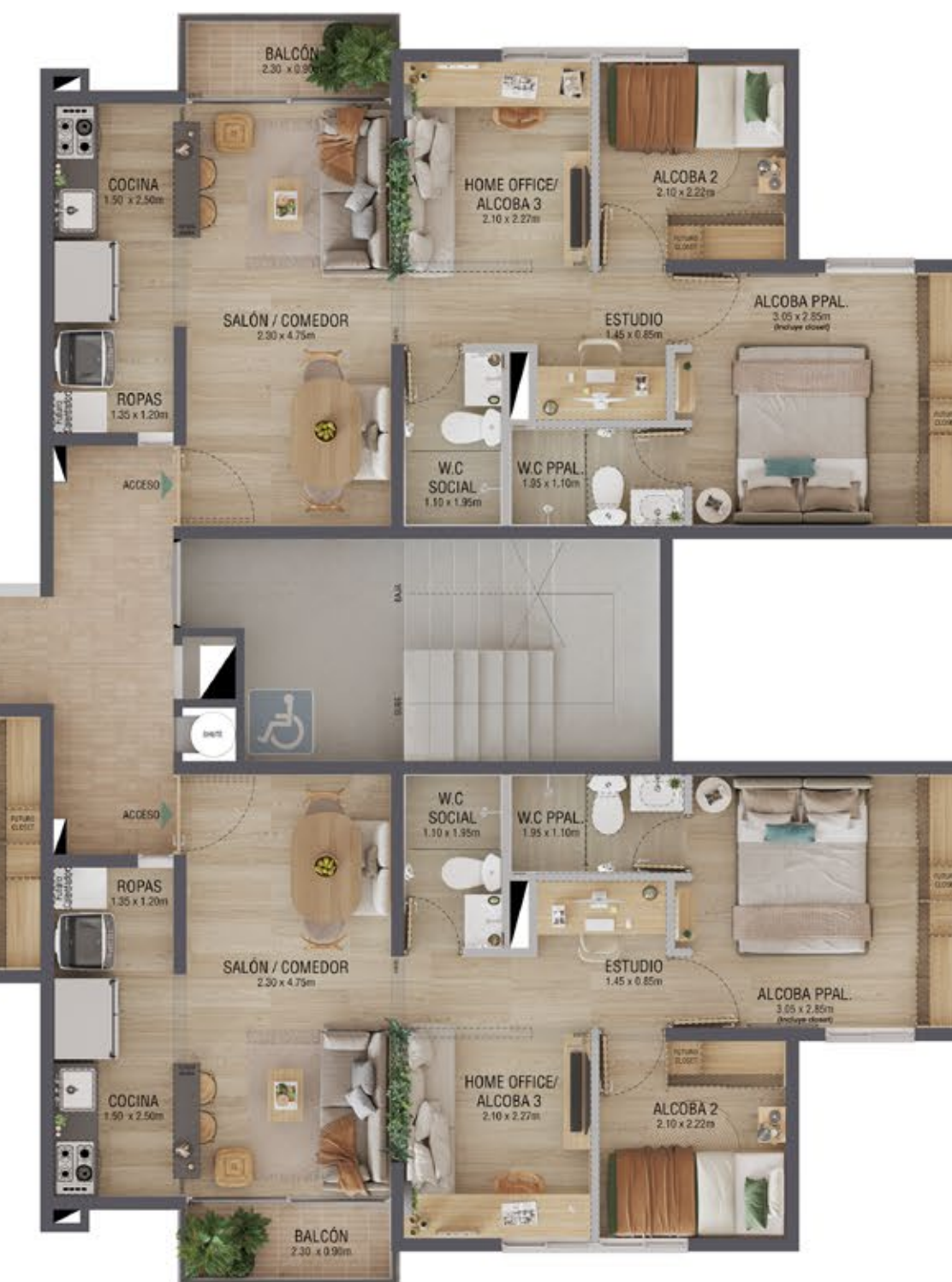
TIPO 1 Área total construida 52 m 2 Área total privada 46,46m 2