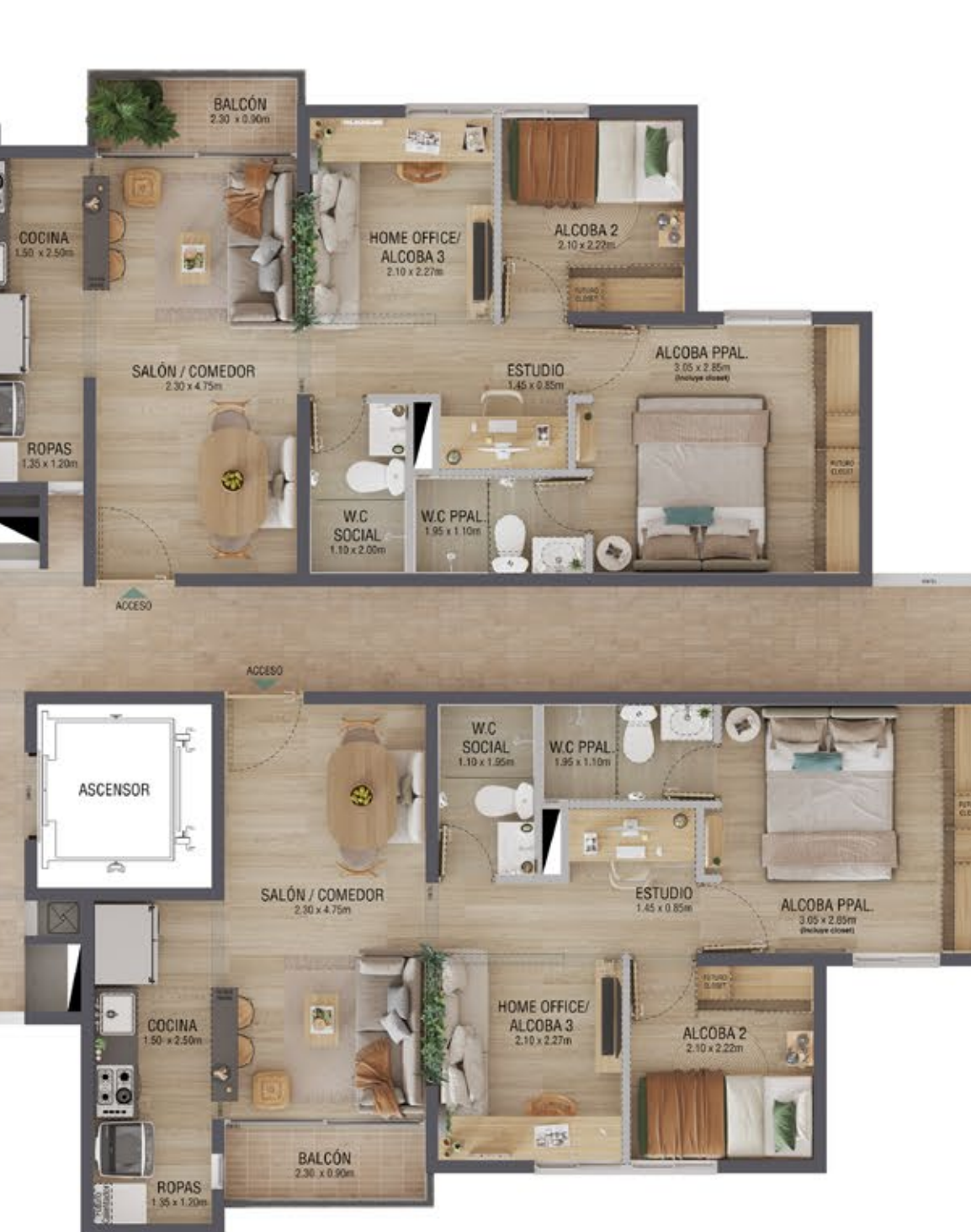
TIPO 2 Área total construida 52 m 2 Área total privada 46,46m 2