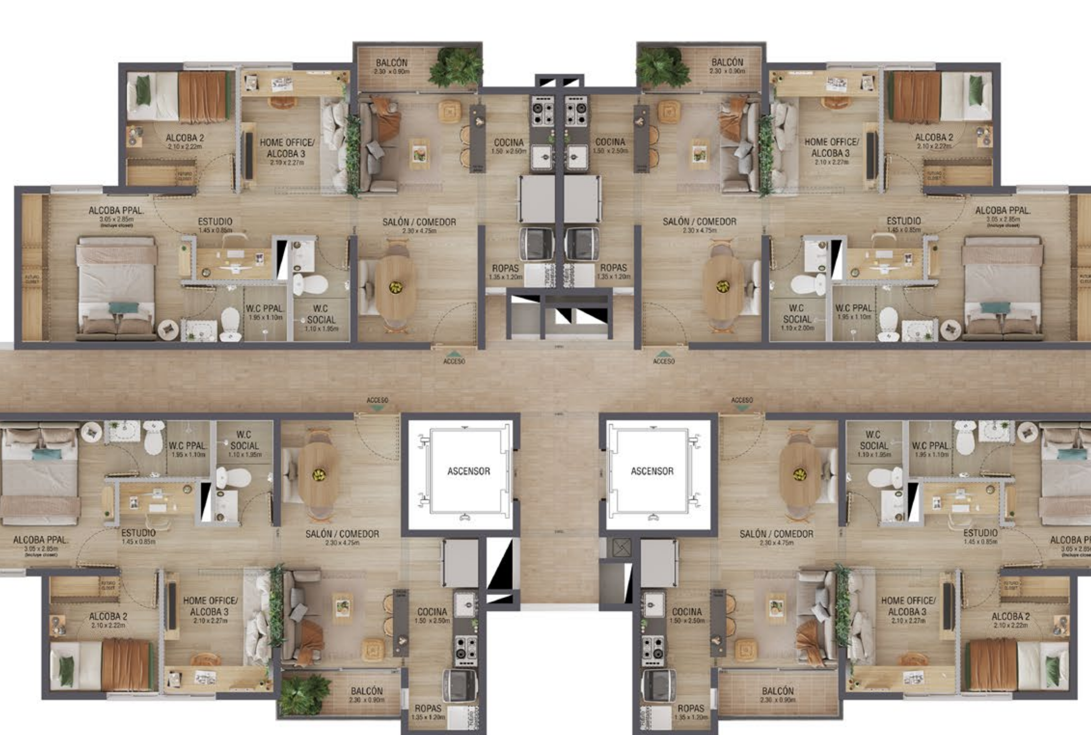
TIPO 2 Área total construida 52 m 2 Área total privada 46,46m 2